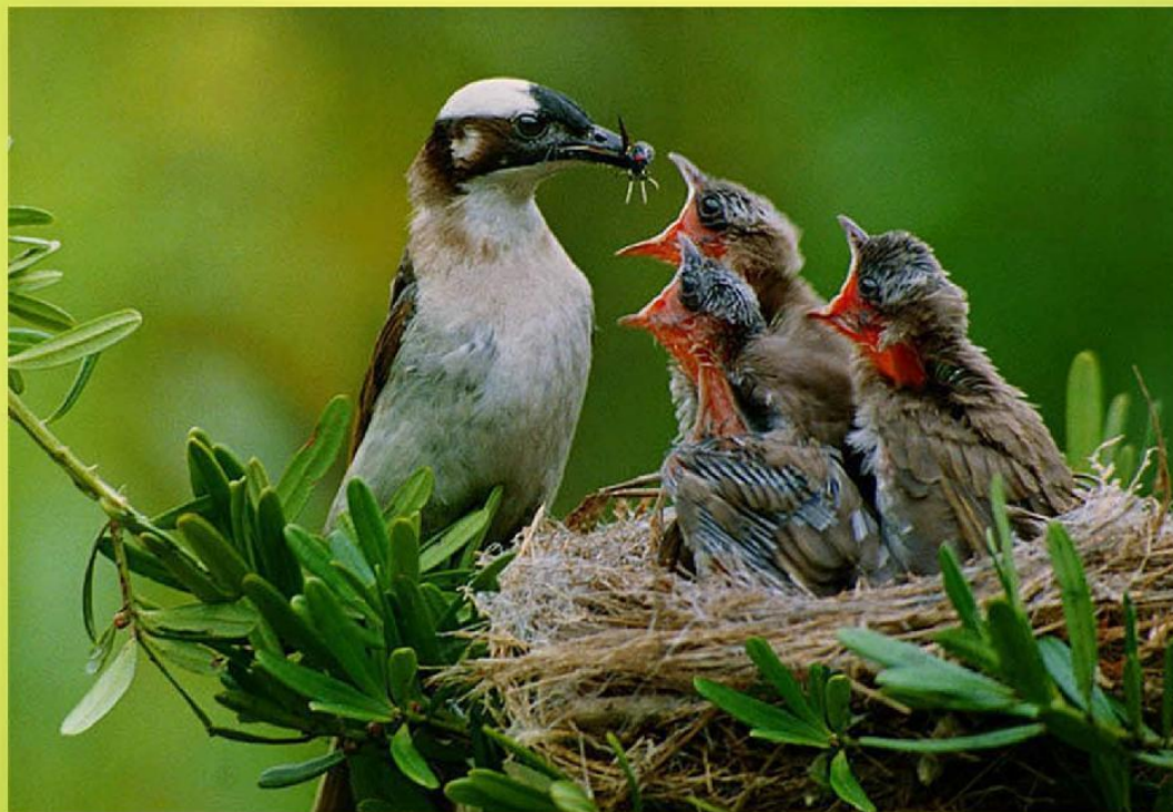
三隻小鳥都飢腸轆轆