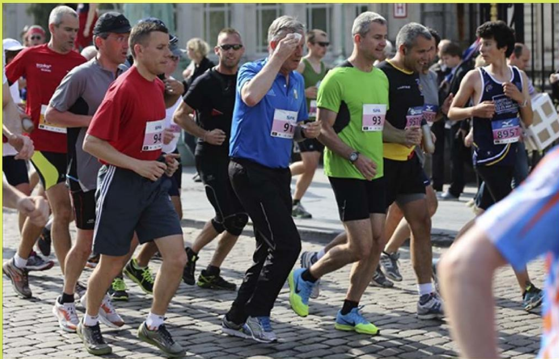
大家跑得滿頭大汗