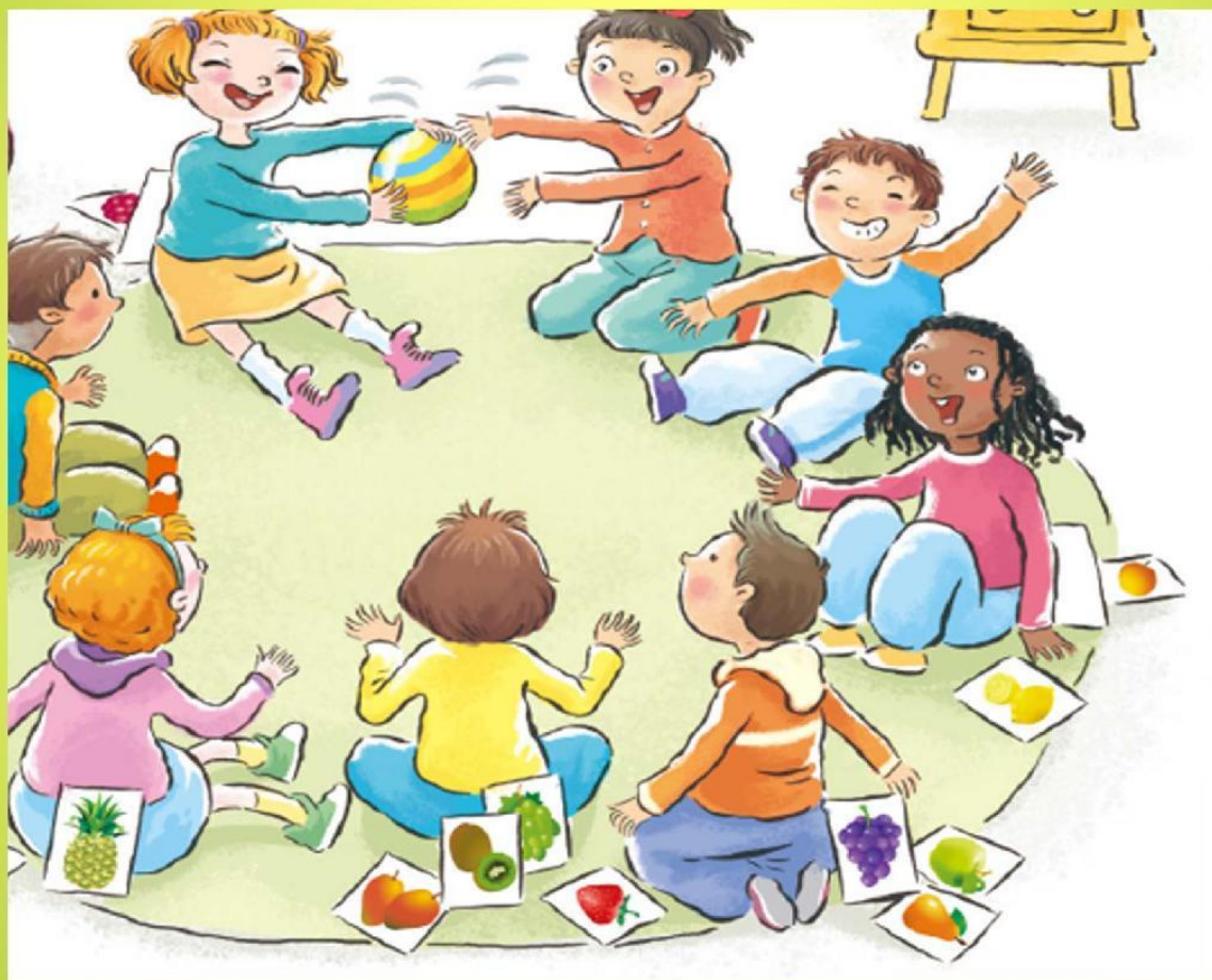
大家快快樂樂玩遊戲