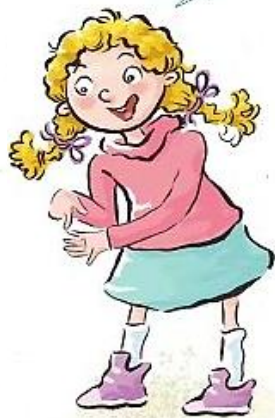
shǒu zhǐ tóu 手指頭