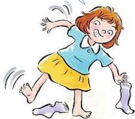
jiǎo zhǐ tóu 腳趾頭