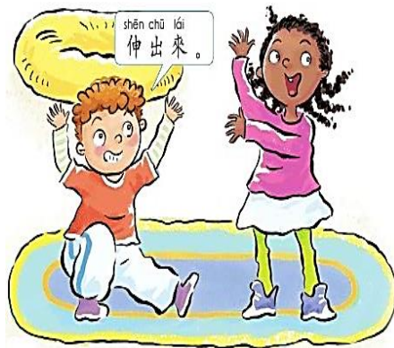
shēn chū lái 伸出來。