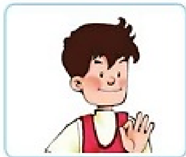
gē ge 哥 哥