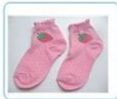
wà zi 襪 子