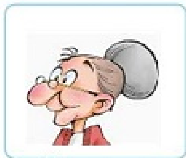
nǎi nai 奶 奶